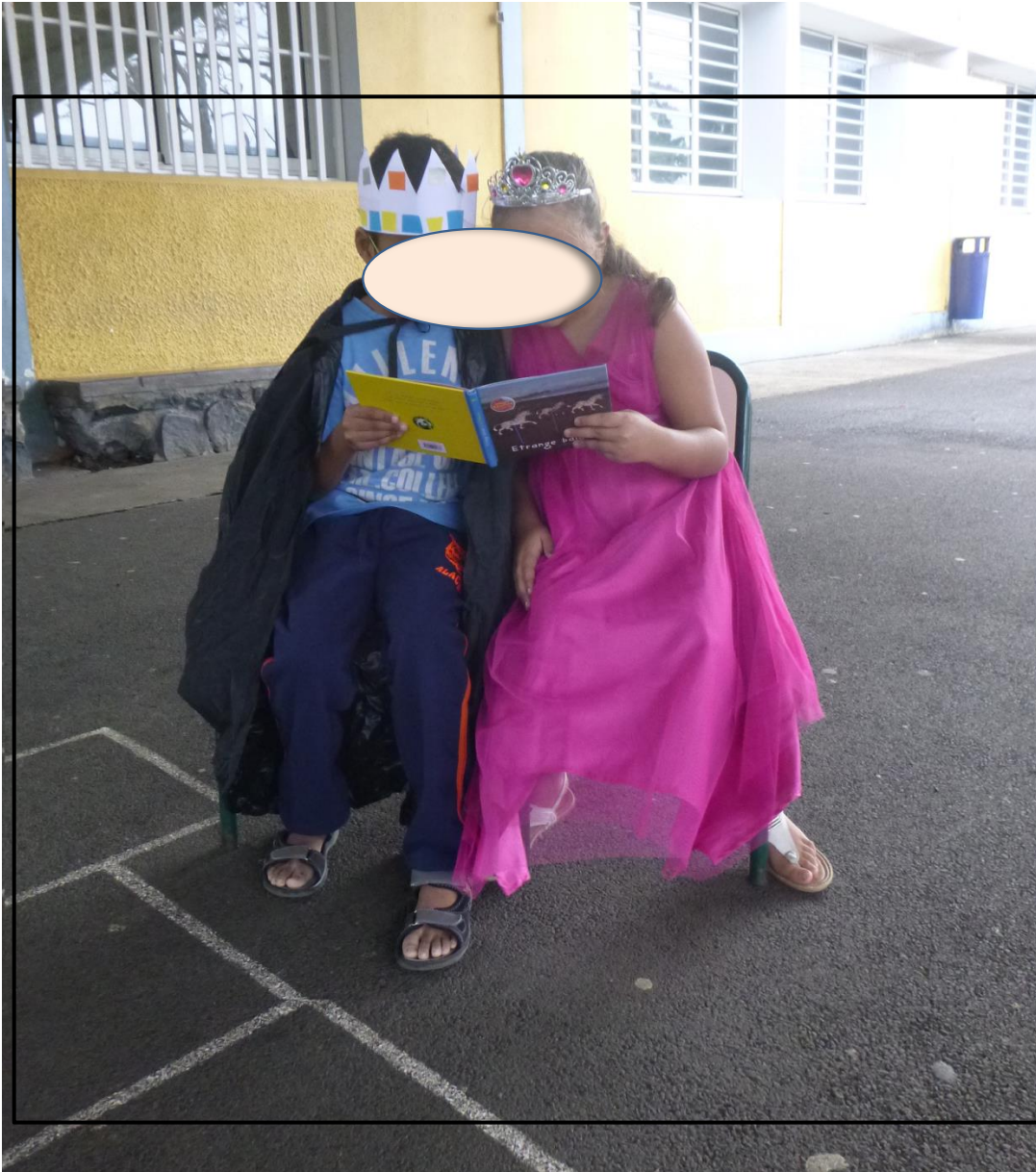
Illustration page 2(droite)

Les visages des enfants ont été volontairement cachés par des auréoles pour préserver leur anonymat.