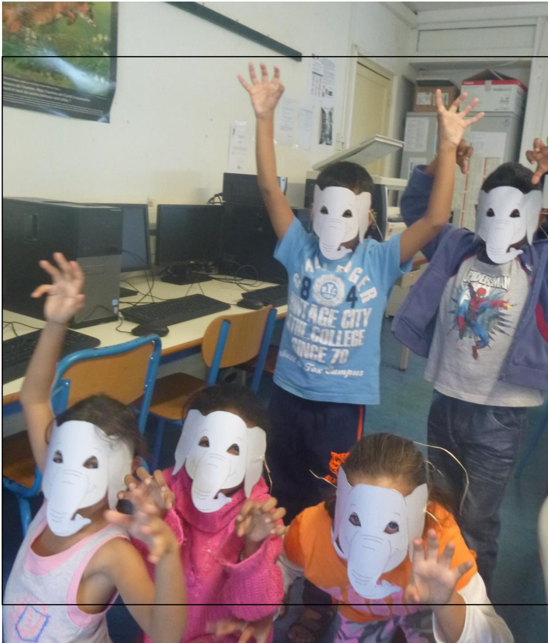
Illustration page 6

Page 5 : « Dans la salle informatique on entendait des éléphants qui faisaient du bruit ! »