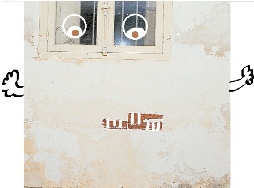
réalisé avec le logiciel de dessin PAINT